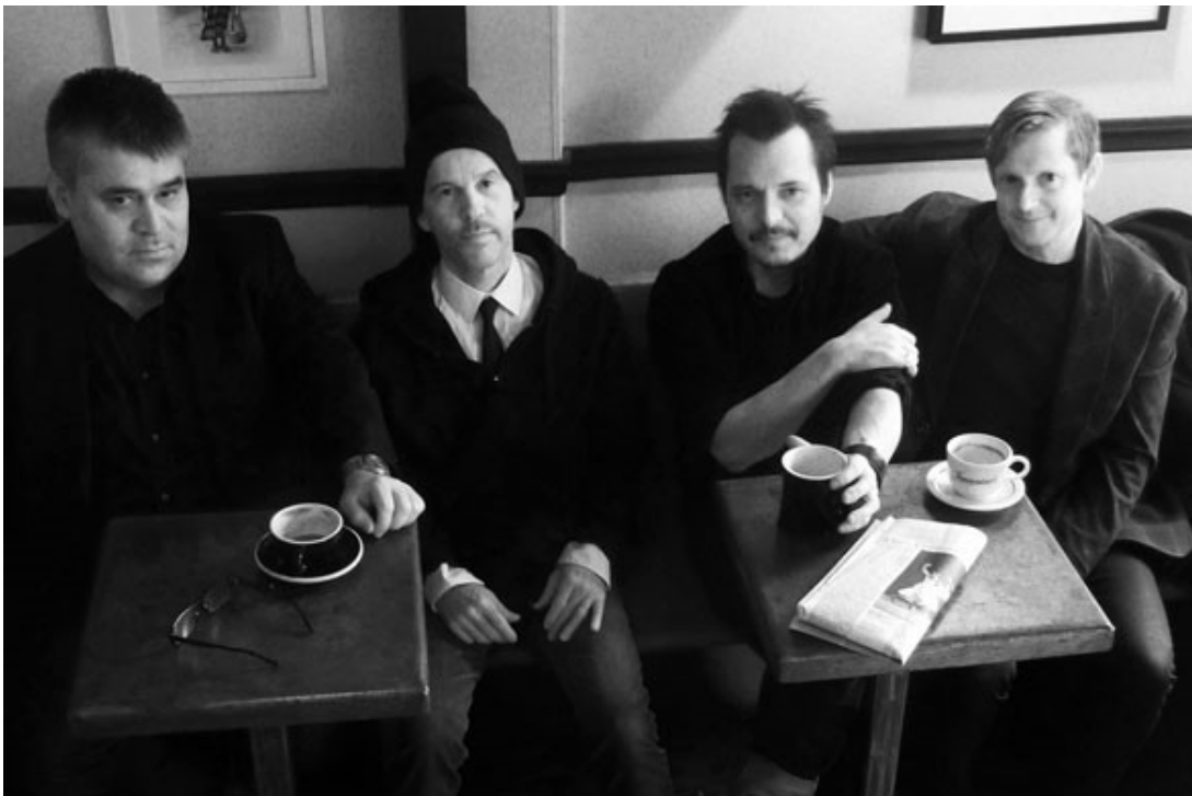
Endangered Blood